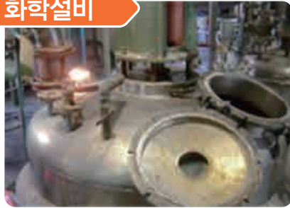
반응기 내부 청소작업 중 질소가스 누출로 인한 산소결핍으로 1명 사망