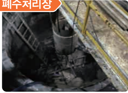
폐수처리시설 침전조내 센서교체 작업 중 황화수소 중독으로 1명 사망