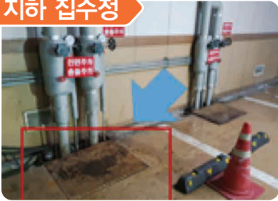
건물 지하 집수정 내 수중모터 수리작업 중 산소결핍으로 3명 사망