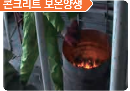
콘크리트 양생 갈탄보충 작업 중 일산화탄소 중독으로 1명 사망

※ 기타 질식재해 발생장소 : 정화조, 상하수도관, 저장용기, 용접배관, 집진설비 등 내부