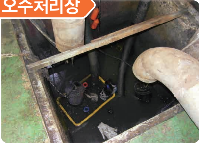
오수처리장 집조수 내 펌프교체 작업 중 황화수소 중독으로 2명 사망