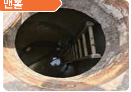
하수관거 공사현장 관로확인 작업 중 황화수소 중독으로 2명 사망